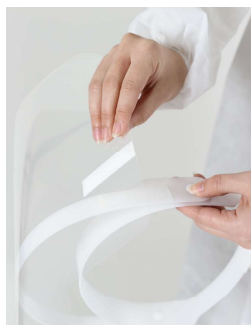
①フレームにシールドを取り付け