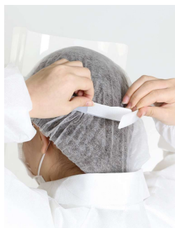
②頭に合わせてフレームを固定